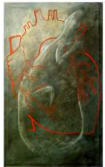
De la serie: EL AZAR DEL MILAGRO Al corazón la culpa CUNA DEL SILENCIO ACRÍLICO/LONA 153 X 93 CMS. 2003