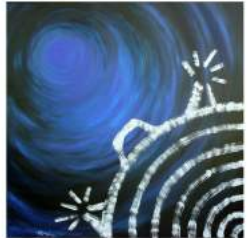
De la serie: TESTIGOS; RITUAL ACRÍLICO/MADERA 120 X 120 CMS. 2008