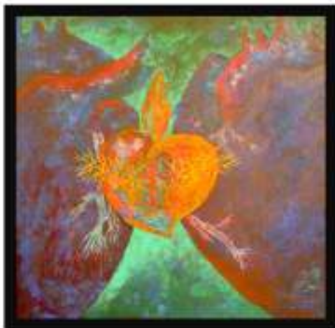
De la serie: EL AZAR DEL MILAGRO Al corazón la culpa DE SANGRE Y ESPÍRITU ACRÍLICO/MADERA 66 X 66 CMS. 2006