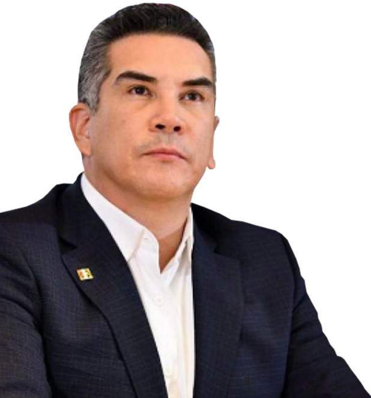
Alejandro Moreno Presidente

A lo largo de los años hemos experimentado cómo, en su método, esta internacional partidaria, ha ayudado en la superación de significativos problemas políticos de nuestra región. Sabemos que por delante hay todavía mucho que caminar, siempre convencidos de que la vía correcta para evitar conflictos es el diálogo constructivo y sincero, que adopta la diversidad como fuente de la verdad. Ese es nuestro compromiso, caminemos.